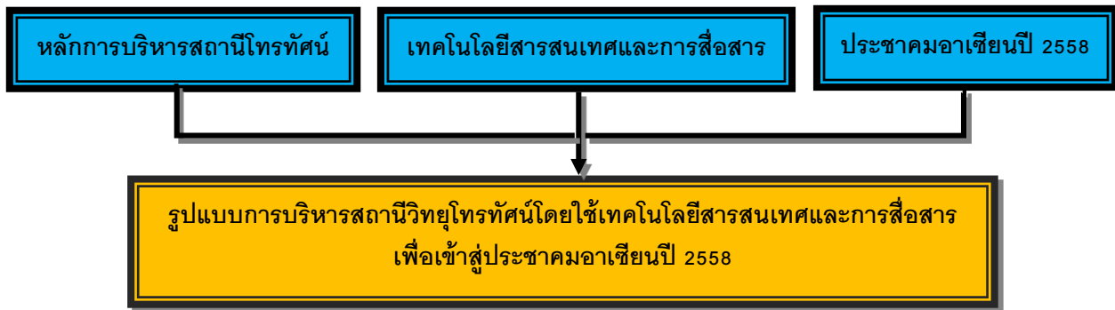
รูปที่ 1: การพัฒนารูปแบบการบริหารสถานีวิจัยโทรทัศน์โดยใช้เทคโนโลยีสารสนเทศและการสื่อสารเพื่อเข้าสู่ประชาคมอาเซียนปี 2558

กรอบแนวคิดการวิจัย เรื่อง การพัฒนารูปแบบการบริหารสถานีวิจัยโทรทัศน์โดยใช้เทคโนโลยีสารสนเทศและการสื่อสารเพื่อเข้าสู่ประชาคมอาเซียนปี 2558 ประกอบด้วย หลักการบริหารสถานีวิจัยโทรทัศน์ การประยุกต์ใช้เทคโนโลยีสารสนเทศและการสื่อสารในการบริหารสถานีวิจัยโทรทัศน์ และสถานีวิจัยโทรทัศน์กับประชาคมอาเซียนปี 2558 ดังแสดงในรูปที่ 1